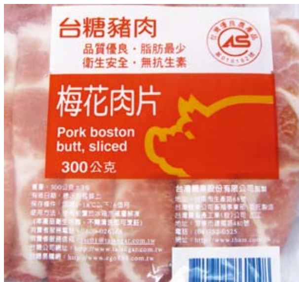
▲CAS產品包裝上除CAS標章外，應標示：品名、原料名稱、淨重、數量或容量、有效日期、廠(場)名稱及地址、保存條件等。

日本政府雖然有對生肉料理制定嚴格的檢驗基準，用於生吃的肉類，在檢測大腸菌群和沙門氏菌時必須為陰性，而且在出售時，必須明確標註“可以生吃”字樣。然而，日本政府並沒有制定相關罰則，於是便發生了不肖廠商將普通牛肉作為可生吃的商品進行販售。據日本食用肉類市場批發協會介紹，肉類的流通從生產農戶到飲食店要經過家畜市場、肉類處理廠、批發市場等多重程批發協會表示，肉類的流通從生產農戶到餐飲店要經過家畜序，由於相關步驟較多，病菌極易混入生肉中。據日本食用肉類市場市場、肉類處理廠及批發市場等多重複雜程式，由於相關步驟較多，病菌極易混入生肉中。