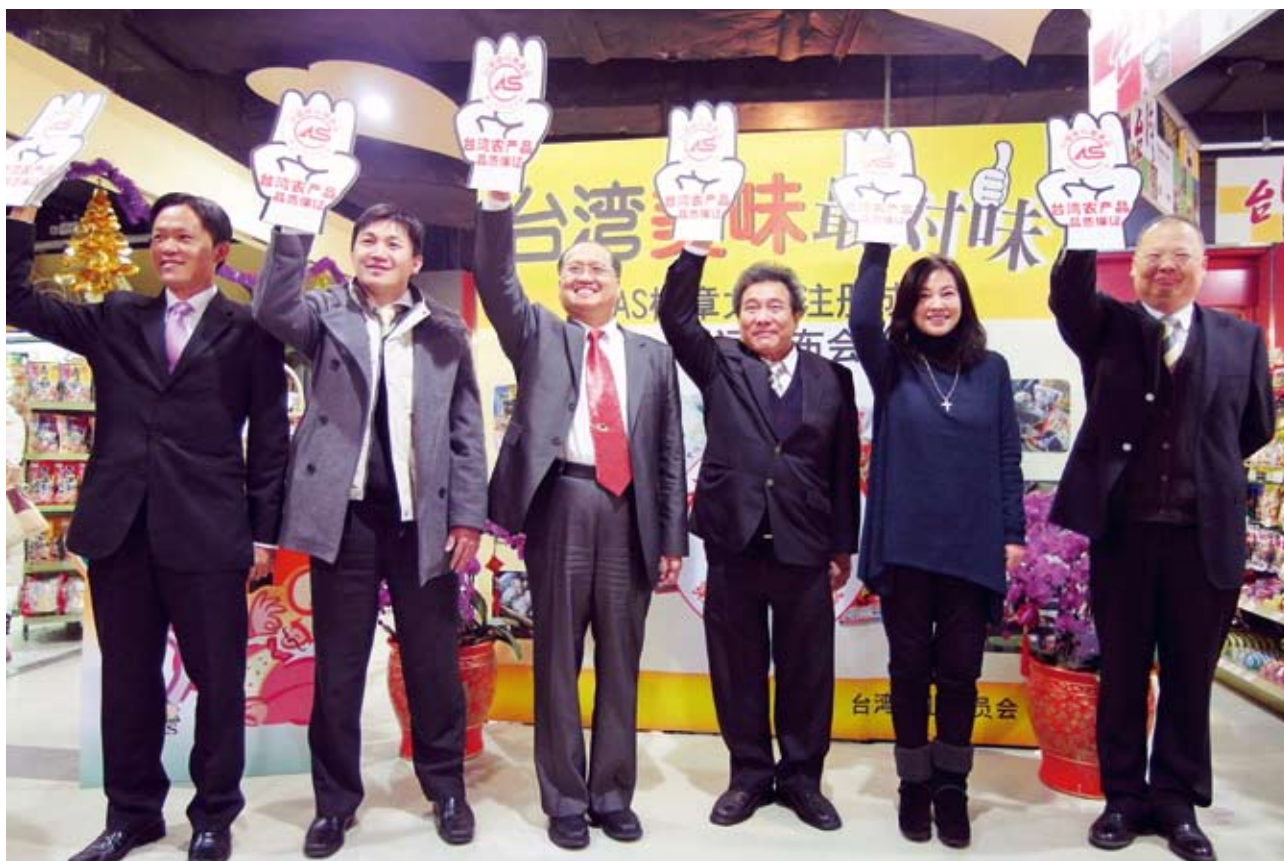
▲畜牧處許處長與業者共同宣示CAS標章在大陸註冊成功