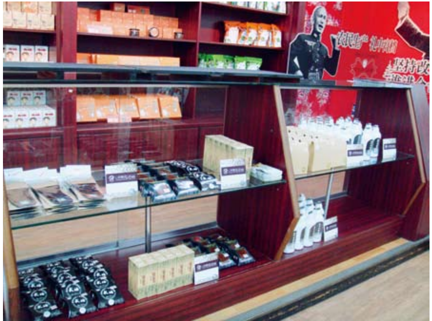
▲南投縣信義鄉農會--梅子夢工廠展售情形

(地址：南投縣信義鄉明德村新開巷11號) 為中區設立的CAS林產品展售專櫃。本協會自民國97年起，與信義鄉農會合作設立「CAS臺灣優良林產品--山林樂活Lohas專區」，利用信義鄉旅遊轉運中心的旅遊及休憩功能，融入健康樂活的概念，以追求天然、養生、環保的自然原則及原料產地化的節能減碳的理念，將CAS臺灣優良林產品行銷推廣給來此地旅遊之國內外消費者。