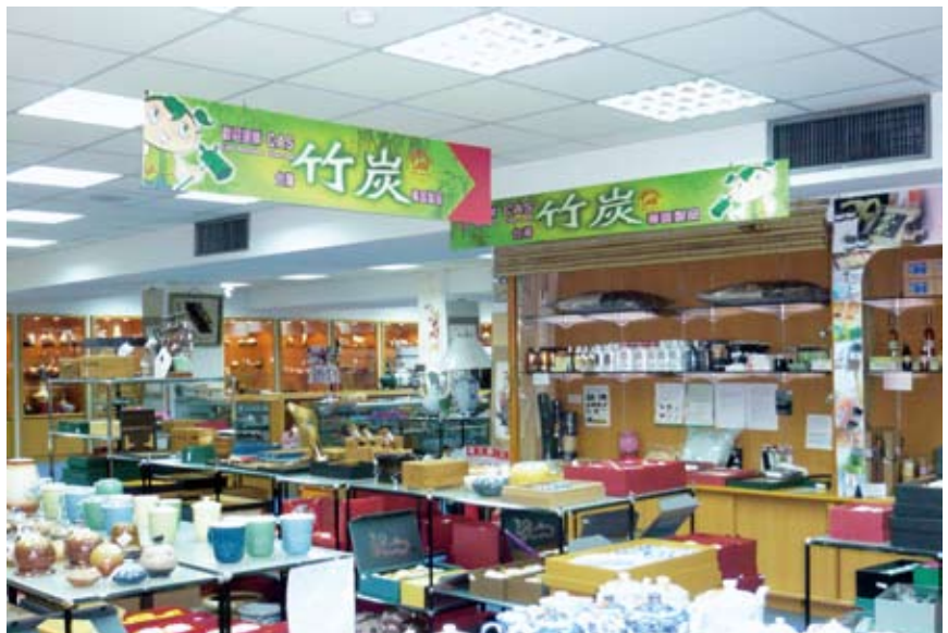
▲高雄義大世界購物中心展售情形

(地址：高雄市大樹區三和村學城路一段12號B區L1流行大道43號，攤位編號：BL143) 為今年度增闢之處展售專櫃。高雄義大世界購物中心是國內第一座結合購物、休閒、娛樂、文化、觀光及美食之大型休閒娛樂型購物中心，預估年度來客數將超過1,000萬人次。有鑑於其帶來之遊客數、知名度及購物商機，遂於此處設立「CAS臺灣優良林產品展售專櫃」，期望協助CAS林產品廠商拓展更豐富且多元化的通路。CAS