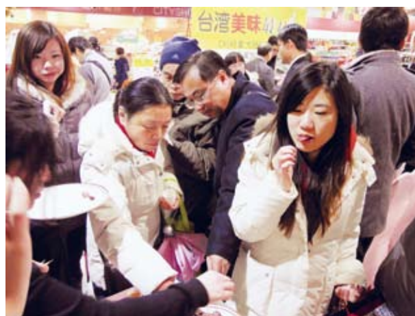
▲記者會活動現場辦理試吃情形

近年來，大陸消費者越來越重視食品安全，對於經認證的食品也相當有信心。臺灣農產品隨小三通或台商或參訪人士的口耳相傳下，「來自臺灣」早已成為精緻優質的代名詞，並深受海峽對岸消費者的喜愛，因此，「CAS台灣優良農產品」在大陸蘊藏著無限外銷潛力。