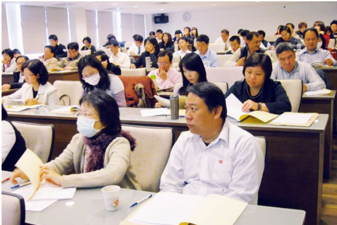
▲高雄場說明會業者踴躍參與實況

隨著2010年11月21日CAS台灣優良農產品標章在大陸取得註冊後，CAS廠商如台畜、嘉一香、凱馨、泓良等所生產之CAS產品，亦於2011年1月首批取得畜禽產品輸銷大陸之許可，讓大陸民眾終於有機會可以正式看得到、買得到屬於臺灣優質的農產品，行政院農業委員會（以下簡稱農委會）旋於1月20日在大陸上海市之「城市超市」時代廣場店辦理「臺灣美味最對味--CAS標章大陸註冊成功」發佈會，由現場展出精緻的CAS產品內容，連結出臺灣CAS產品的優質形象。