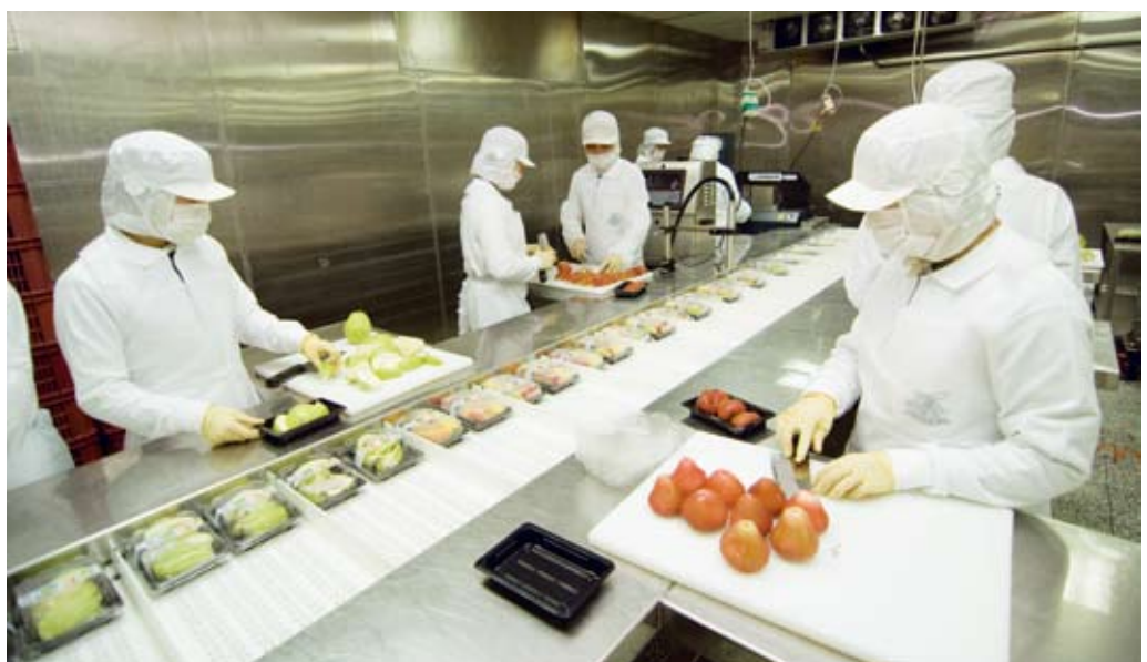
▲冷藏截切室分切及包裝作業