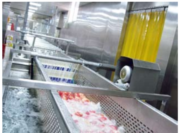
▲第二槽：4-8°C冰水加氣泡式漂洗