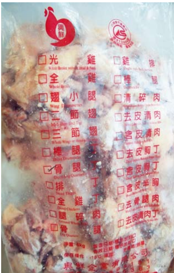
▲只有CAS產品沒有CAS工廠，選用CAS產品請認明包裝上CAS標章。

為確保消費大眾飲食安全及CAS廠商自身商譽，本驗證機構除加強CAS各項產品抽檢頻率外，並將持續要求CAS廠商加強原物料來源自主管理，以及製程和衛生安全管控，落實進貨、庫存之原料與產品品質管理及來源監督，建構更安全之食品管理系統。CAS