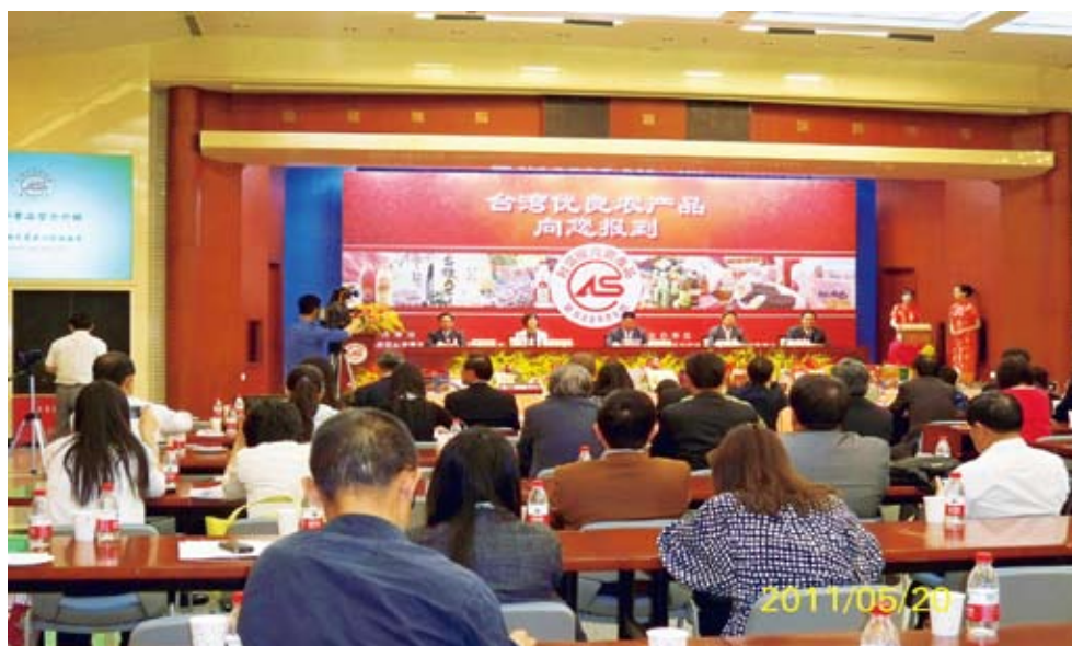
▲大陸媒體踴躍出席記者會情形（貿促會禮堂）