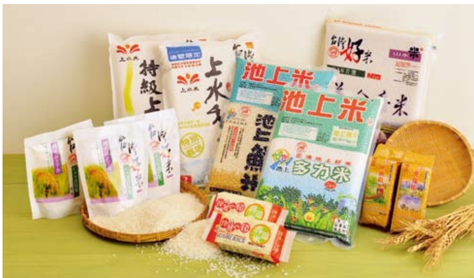
▲CAS台灣食米系列產品

台灣米與進口麵粉比較起來，更自然更營養又更符合節能減碳之環保觀念，我是領有證照的營養師又是食品技師，學有專精，今日很誠懇的推廣台灣好米，為我們農地的充分利用，為我們的農民，也為提升國內糧食之自足率，請大家多吃米飯，米飯係最平凡的主食食物，加上變化的調理，如米粉、碗粿、粿條，蘿蔔糕、粽子、米苔目等，不但健康我們的身體，也增添了飯桌的樂趣，也溫暖了辛苦力作的台灣稻農，何樂而不為？CAS