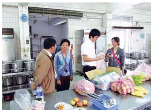
▲學校午餐廚房CAS食材稽核情形