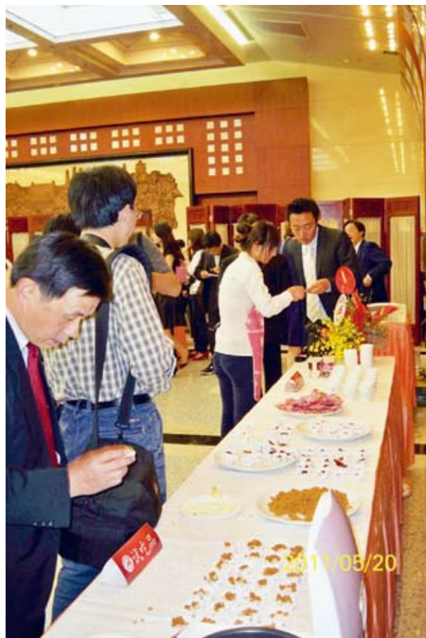
▲媒體現場品嚐CAS產品

本協會董事長於記者會中特別說明即將在大陸展開之系列性CAS農產品拓銷活動，其中預計於本年7月14日至17日在北京中國國際展覽中心舉行之「第2屆海峽兩岸台灣優農產品洽商大會」乃為重頭戲之一。該洽商大會係去年由農委會輔導本協會舉辦第一屆，邀請大陸近400位專業買主來台進行洽商，創造新台幣近億元之後續洽談訂單。本年農委會持續輔導CAS協會辦理第二屆，並移師大陸政經中心之北京辦理，屆時將會有近80位台灣CAS業者親自參展，展示及行銷500多項產品，並與大陸專業買主進行貿易洽談，期能拓展行銷通路網。另外，農委會也輔導本協會與北京地區學校之設計學系合作辦理CAS標章公仔設計圖比賽，以創造行銷話題，並期透過電視、廣播、報紙等平面媒體之廣告宣傳，深化CAS農產品於大陸民衆之印象；同時，並規劃與大陸超市通路合作開設CAS農產品專櫃，佈建長期穩定通路，打造CAS台灣優良農產品之黃金品牌。CAS