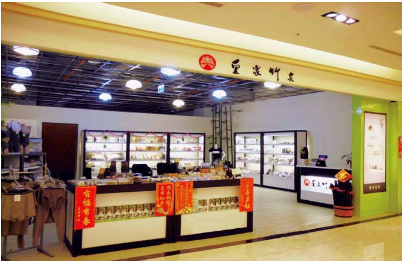
▲台灣手工業推廣中心展售情形

北區展售專櫃預計設立於臺灣手工業推廣中心（地址：臺北市徐州路一段1號2樓），自民國94年起，手工業推廣中心即與本協會合作設立「CAS臺灣優良林產品--竹炭產品專區」，積極辦理CAS林產品行銷推廣活動，使CAS林產品逐漸為廣大消費者熟知，且手工業推廣中心為全國規模最大工藝品展售場所，現場展售國內手工藝品種類多達5萬餘種，成為外賓及國內外遊客必經之地，也提升了CAS林產品國際的知名度，帶動購買風潮。