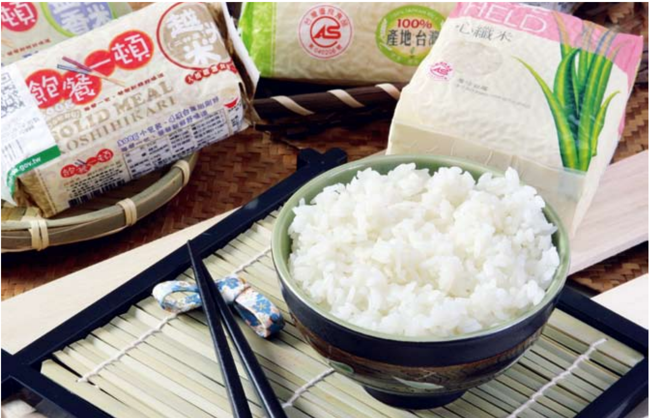
▲天賜美食，最自然的主食--米飯

旅居加拿大多年的朋友，每年回國，最懷念的食物就是台灣的白米飯，請他吃飯，總是飯吃了一大半碗，還未配菜，他說台灣米太好吃了，忘了吃菜。