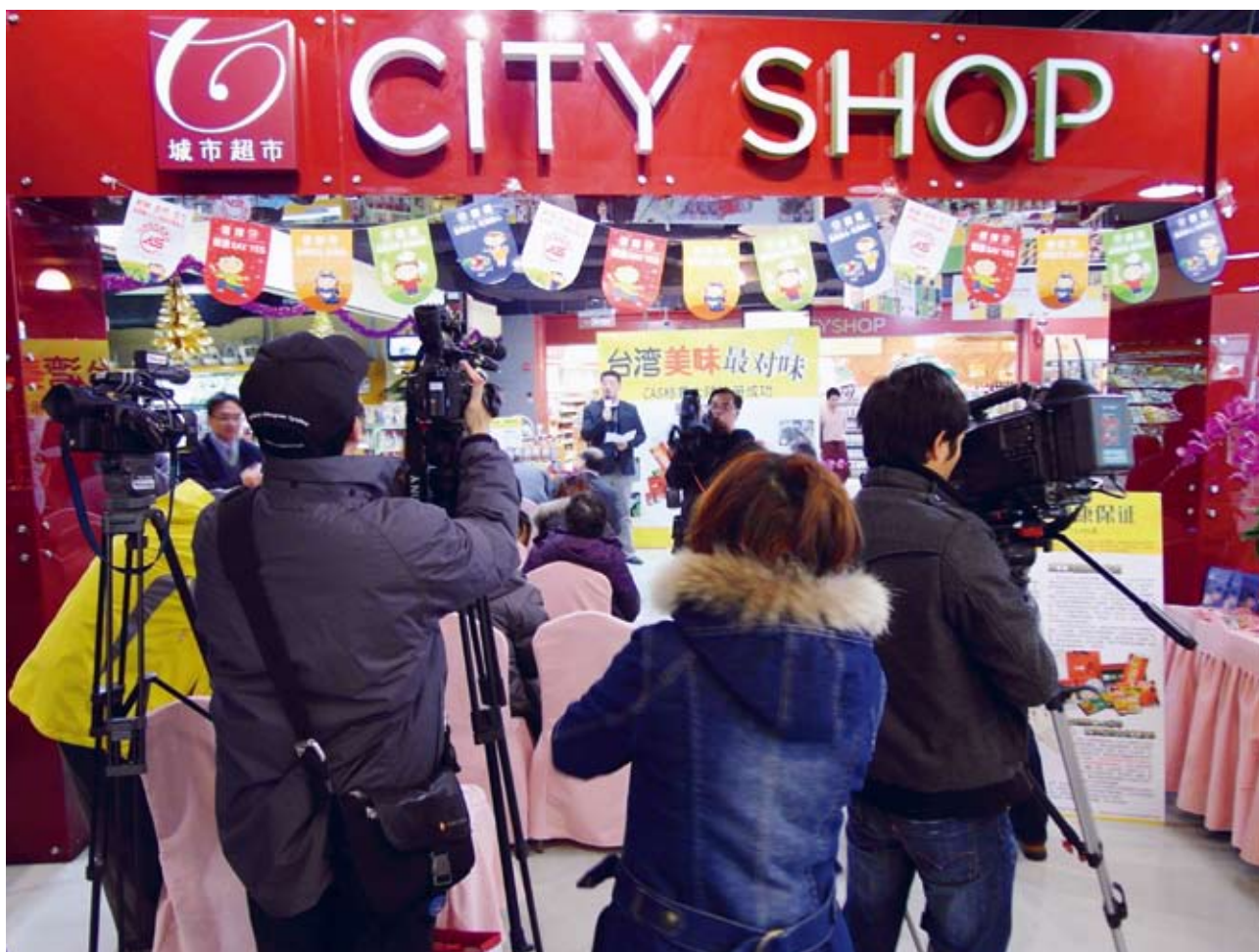
▲上海城市超市記者會現場

目前農委會動植物防疫檢疫局等單位正積極與大陸官方接洽，盼儘速建立暢通之檢疫平臺，期許CAS產品可大量輸往大陸，預計未來將以上海、北京及廈門為中心，尋求臺灣及大陸進出口商及通路商建構大陸銷售通路，把臺製優良肉品及其他農產品向內陸銷售，讓大陸消費者看得到、更買得到真正來自臺灣的CAS產品。