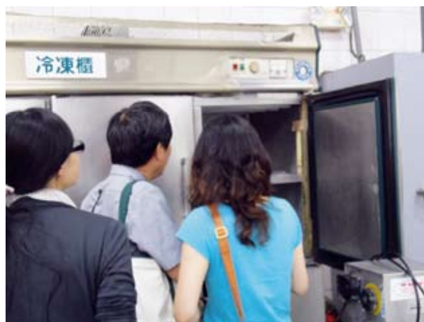
▲團膳公司CAS食材稽核情形